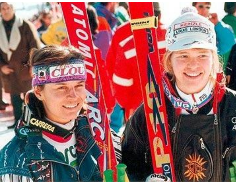
Ulrike Maier 1994